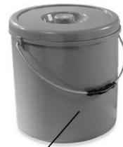
Pattumiera Nr. 1