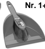
Paletta + spazzola Nr. 1+1