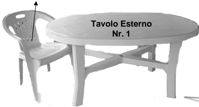
Tavolo Esterno Nr. 1