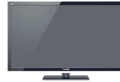
TV Nr. 1