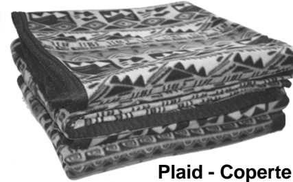
Plaid - Coperte Nr. 3