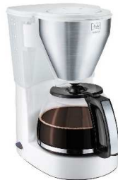
Macchina caffè Nr. 1