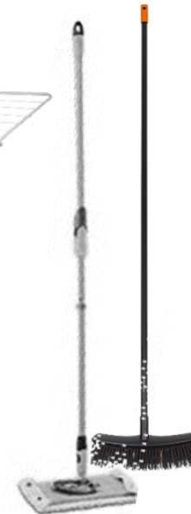
Spazzolone e scopa Nr. 1+1