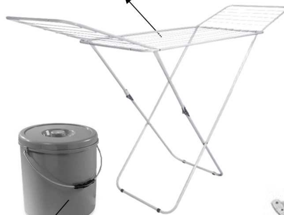
Stendino Nr. 1