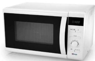
Microonde Nr. 1