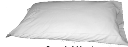
Cuscini Nr. 4