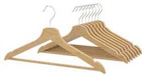
Appendiabiti Nr. 20 Coat-hangers