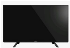
TV Nr. 1