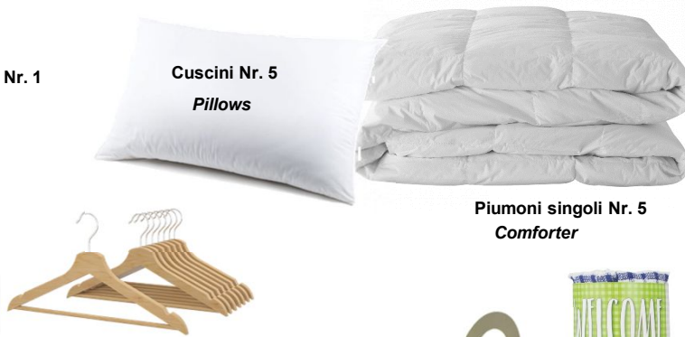
Cuscini Nr. 5 Pillows