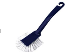
Spazzola per piatti Nr. 1 Dish brush