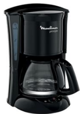
Macchina caffè Nr. 1 American coffee maker