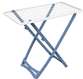
Stendino Nr. 1 Drying rack