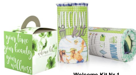
Welcome Kit Nr 1 Welcome kit