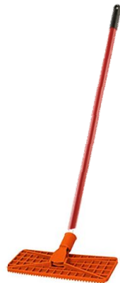
Spazzolone Nr. 1 Floor scrubbing brush