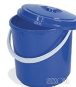
Pattumiera Nr. 1 Rubbish bin