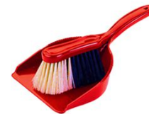
Paletta + spazzola Nr. 1 Dustpan and brush

Verificate che l'inventario in dotazione sia completo. Il giorno della partenza, dopo un controllo di un nostro incaricato, vi verrà addebitato l'importo degli oggetti mancanti, qualora la reception non ne fosse stata informata all'arrivo.