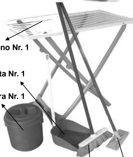
Paletta Nr. 1