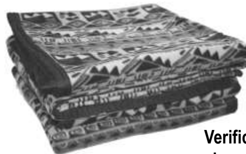
Coperte Nr. 3