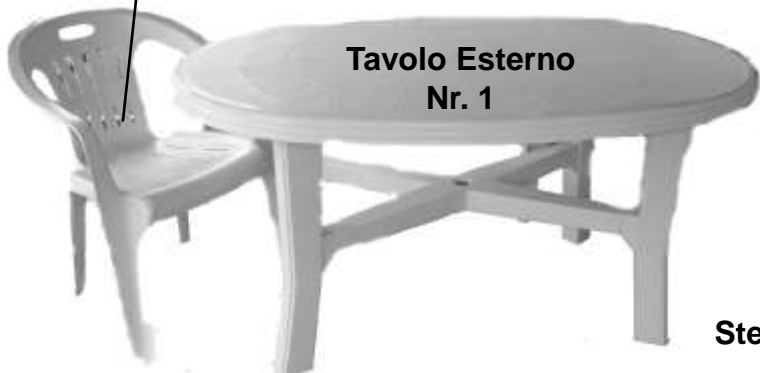
Tavolo Esterno Nr. 1