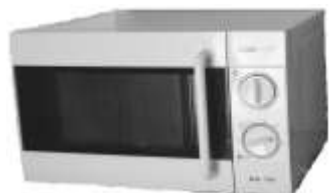
Microonde Nr. 1