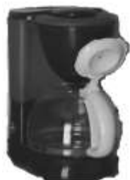
Macchina caffè Nr. 1