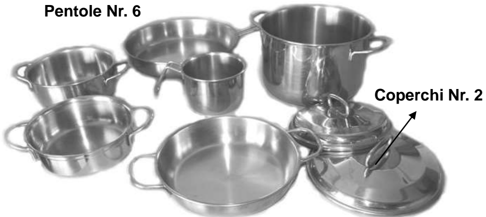
Coperchi Nr. 2