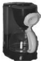
Macchina caffè Nr. 1