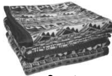
Coperte: una per letto.