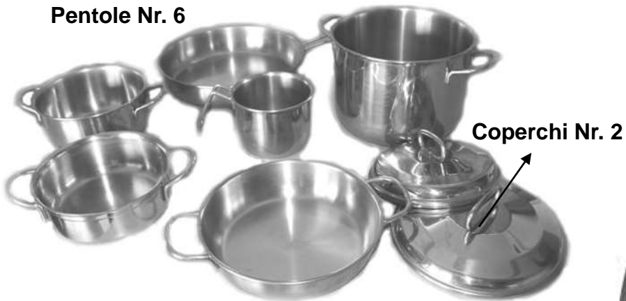
Coperchi Nr. 2