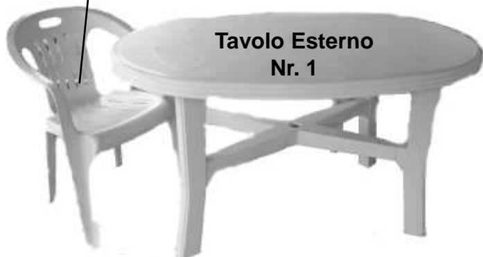
Tavolo Esterno Nr. 1