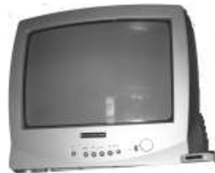
TV Nr. 1