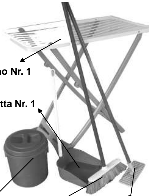
Paletta Nr. 1