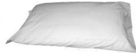
Cuscini Nr. 3 / 5

Verificate che l'inventario in dotazione sia completo. Il giorno della partenza, dopo un controllo di un nostro incaricato, vi verrà addebitato l'importo degli oggetti mancanti, qualora la reception non ne fosse stata informata all'arrivo.