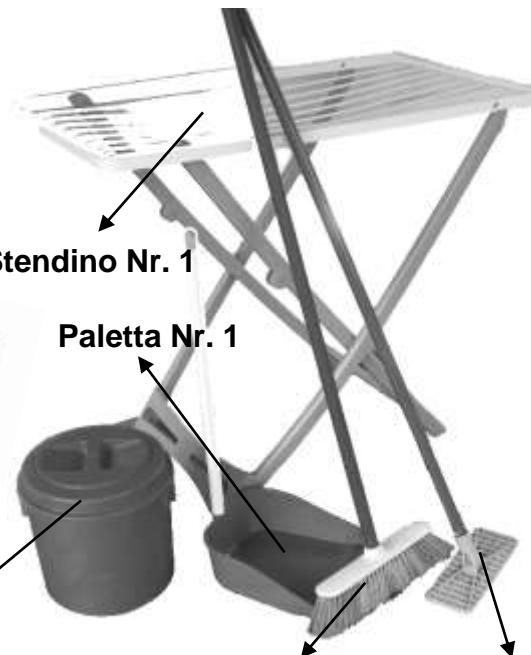
Paletta Nr. 1