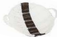
Cestino per la frutta Nr. 2