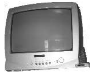
TV Nr. 1