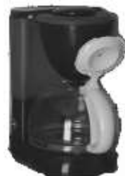
Macchina caffè Nr. 1