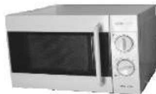
Microonde Nr. 1