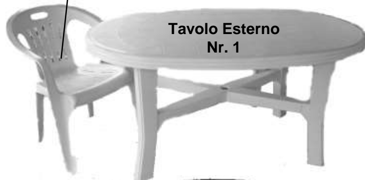
Tavolo Esterno Nr. 1