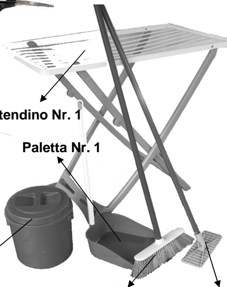
Stendino Nr. 1