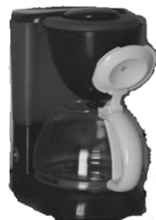
Macchina caffè Nr. 1