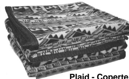
Plaid - Coperte Nr. 5