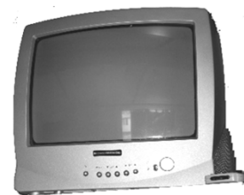
TV Nr. 1