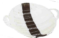
Cestino per la frutta Nr. 1