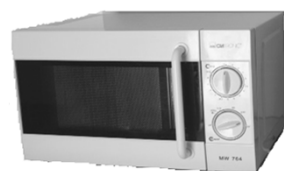
Microonde Nr. 1