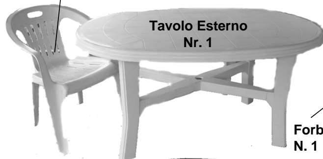
Tavolo Esterno Nr. 1