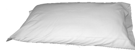
Cuscini Nr. 6

Verificate che l'inventario in dotazione sia completo. Il giorno della partenza, dopo un controllo di un nostro incaricato, vi verrà addebitato l'importo degli oggetti mancanti, qualora la reception non ne fosse stata informata all'arrivo.